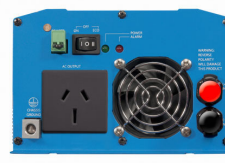
Phoenix Inverter 12/800 with AN/NZS 3112 socket