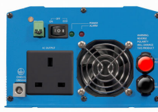
Phoenix Inverter 12/800 with BS 1363 socket