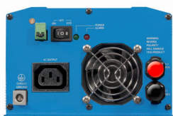
Phoenix Inverter 12/800 with IEC-320 socket