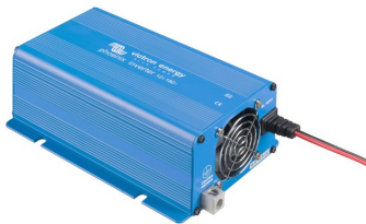
Phoenix Inverter 12/180