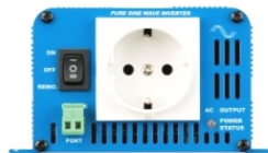
Phoenix Inverter 12/180 with Schuko socket