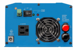
Phoenix Inverter 12/800 with Nema 5-15R socket